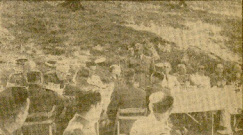
Gran Comandante de S. E. el Sr. D. Franco. Presidencia de las Peñas de Aya. Ejercicio de la División de Infantería de Marina. El Generalísimo con el Comandante en Jefe de la División de Infantería de Marina, Sr. D. [Nombre], y el Comandante en Jefe de la División de Infantería de Marina, Sr. D. [Nombre].