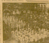
Una gran manifestación de fe de la juventud católica en Eibar...