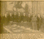
Una reunión de la nueva corporación provincial de Euzkadi...