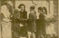
Una niña del 2º de primaria del pueblo de S. B., en un momento de su participación en el homenaje que se hizo en la parroquia de San Antonio.