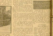
Los árboles de la Avenida, entre faroleros y faroleros, resalta su estrechez.