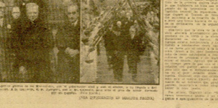
El grupo de misioneros que se dirige a San Sebastián...