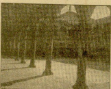
El templo de San Juan de los Baños...