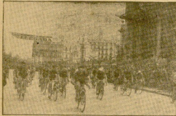
En la gradación... En la gradación... En la gradación...

LA VOZ DE ESPAÑA, de acuerdo con el maestro Usandizaga, gestiona la interpretación de su "Bona de Altopiani"