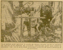
En el cuadro... En el cuadro...