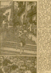
En el cuadro... En el cuadro...