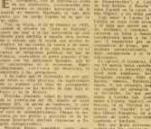
En el cuadro... En el cuadro...