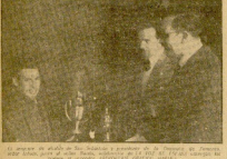
En el cuadro... En el cuadro...