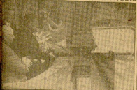
El Caudillo presenta al pueblo de Fuenterrabía, en un momento del acto de la entrega de la bandera de honor, el escudo de la ciudad de Fuenterrabía.