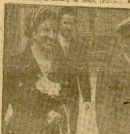
El Caudillo y su familia, acompañados del jefe de la Guardia Civil, en la localidad de Fuenterrabía.

El jefe del Estado visitó ayer a los manizales de Fuenterrabía, en un momento del acto de la entrega de la bandera de honor. El Caudillo, acompañado de su familia, se desplazó a la localidad de Fuenterrabía, en un momento del acto de la entrega de la bandera de honor. El Caudillo, acompañado de su familia, se desplazó a la localidad de Fuenterrabía, en un momento del acto de la entrega de la bandera de honor.