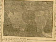
El obsequio del Frente de Juventudes a doña Carmen Polo de Franco.