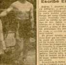
Escríbe Escartín desde Madrid.

Madrid. El Español de la Voz... (text continues with football betting information)