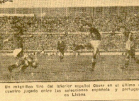
Un momento con el interior español desde el último campeonato jugado entre las asociaciones española y portuguesa en Lisboa.