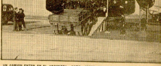
UN CAMION ENTRA EN EL "PACKET", COMO JORAS EN EL VIENTRE DE LA BALLENA

Los inventos de la guerra para las necesidades de la paz. El vagón volante y la escuela de pilotos. Los inventos de la guerra para las necesidades de la paz. El vagón volante y la escuela de pilotos.