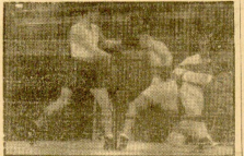
Entrenando en la cancha en la casa de Solano.

Señalado de los campeones de balón a mano en España: R. Sociedad y Esperanza. El primer partido se disputó en el campo de la R. Sociedad, el día 15 de mayo. Ambos equipos jugaron un partido muy interesante, pero al final ganó la Esperanza por 2 a 1.