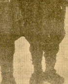
Una típica característica de la población del país. En estos días se refiere más a la mujer y a su belleza y a su coquetería.