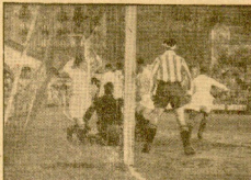
Acuña de batido por el primer gol de la Real, a los 20 minutos.