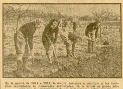
En la guerra de 1914 a 1918, se les permitió a las mujeres abandonar sus hogares para trabajar en las fábricas y en las oficinas. (E.F.S.).