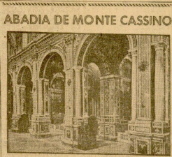
Un interior de la hermosa ciudad, recientemente destruida por su bombardeo aéreo (Foto A. J. J.).

Madrid, 13. — El papa ha emitido un llamamiento a la fraternidad entre los hombres de los dos campos beligerantes, pidiendo una mitigación de su sufrimiento.