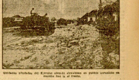
Unidad de tropas del Ejército almorárabes en un punto estratégico en marzo del año 1108.

Junto al sepulcro del Conde Compartiendo, a orillas de nuestro río, una mesa sencilla y modesta, pero con el ambiente de la celebración de una gran fiesta, el Caudillo de España, el generalísimo Francisco Franco, se reunió con los señores de la corte de los reyes católicos, el conde de Castañeda y los señores de la corte de los reyes de Aragón, en un momento de la recepción que el Caudillo de España realizó en la noche del 4 de septiembre en el castillo de Burgos.