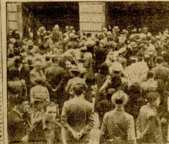
En la figura de la P.P. Juanita se ve a un soldado que, según se dice, se encuentra en la residencia de los jesuitas. Nueva foto tomada el momento de la salida de la zona.