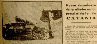
Desembarco de tropas, en la noche, en un punto de Sicilia. La zona de la batalla, a la izquierda, se extiende a lo largo de las costas de Sicilia.