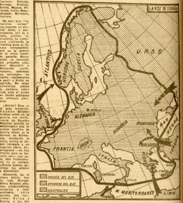
Map showing military fronts and strategic locations like the Atlantic, Mediterranean, and various countries.