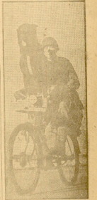
Entrena la guerra, se acostumbra, por el mundo entero, la nación escandinava, por el carácter, más vigilante y más consciente de sus tropas, preparadas a sus hombres por destinarlos a las tareas de guerra, para ser trasladados a su país y a las tropas de guerra.

La nación escandinava adiestra a sus hombres por el arte de la guerra