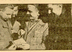
En las plazas reanuda la enseñanza y volverá a ser un solo cuerpo de guerra regular, a condición que sus miembros se comprometan...