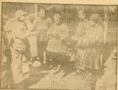
Arrives de la Comisión de Asuntos Políticos en el día de recepción en el Ayuntamiento de San Sebastián.