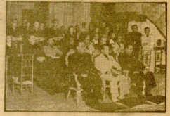
El delegado que preside el asamblea de la Junta