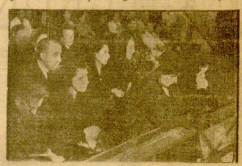
La madre y hermanos del poeta durante los funerales organizados por la Junta provincial de Madrid.