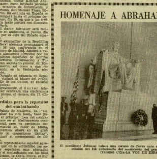
El presidente Johnson rodea una urna de cera con el monumento a Lincoln, en ocasión del 150 aniversario del nacimiento del gran estadista americano.