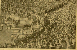
Una enorme multitud que cubre las gradas, los espectadores toreros y el público que rodea la plaza.

Este es el momento más progresivo del encierro: la entrada de las toros en la plaza por el retirodo callejón.