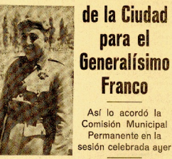
(VEA NUESTRA INFORMACION EN LA PAGINA CUINTA)