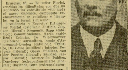
Pierlot y Defensa nacional, general Escalé.

La vida del nuevo Gobierno no será de larga duración