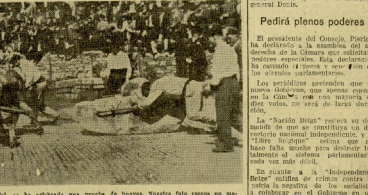
En Eibar, a beneficio de Acción Social se ha celebrado una prueba de bueyes. Nuestra foto recoge un momento de esta típica fiesta Eibarresa.