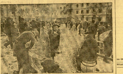
Barcelona liberada después de la liberación.