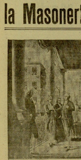
Washington presta juramento presidencial sobre su Biblia masonica.