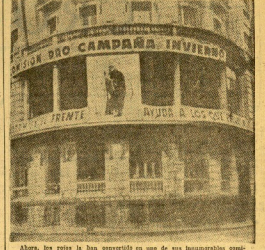
Ahora, los rojos le han convertido en una de sus baterías más importantes... (Text continues describing the monument's strategic importance).

PRECIO DE SUSCRIPCION: España: Tres meses, 175; seis meses, 325; un año, 675. Extranjero: Tres meses, 210; seis meses, 375; un año, 750.