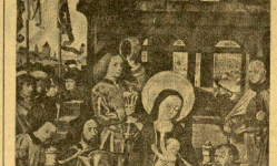
CELEBRA Hoy LA IGLESIA CATHOLICA LA FIESTA DE LA EPANFANIA, NIÑUENOS DEL DONO DE LA IGLESIA ROMANOSA DEL "RATA".

PRECIOS DE SUSCRIPCION: España: Tres meses, 210; seis meses, 370; un año, 670. Extranjero: Tres meses, 270; seis meses, 430; un año, 870.