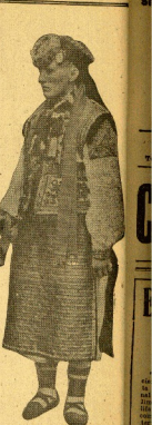
Un marinero con su atuendo típico.