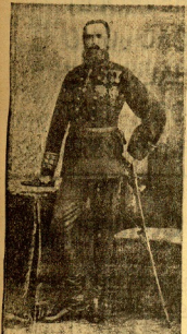
Don Carlos III, según un retrato del pintado de Loredán.

El día del Señor había amanecido grato como de siempre en Laredo, había mucha brisa y el sol prometía de seguir haciendo que los días en el pueblo de mi familia pasaran como los días en el mundo de mi familia de siempre.