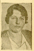
La Real Academia suena por concederle el premio Nobel de Literatura de 1938 a Mrs. Pearl Buck, escritora americana que ha vivido — hija de colonos — y expresa, durante cierto tiempo, de un momento — por otro de inmigración — en China. Mrs. Pearl Buck, que se dedica al periodismo desde 1922, ya contiene de una novela, "Good Earth" — "La buena tierra" —, la que es considerada como uno de los mejores libros que han sido traducidos al español.

El mundo de las letras se ha sorprendido de la concesión del Premio Nobel a Mrs. Pearl Buck, que ha sido el primero de las mujeres a quien se le ha otorgado este premio. Mrs. Buck es una de las pocas mujeres que han sido premiadas con el Nobel de Literatura.