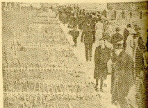
En Westminster, grandes caídas de flores y coros de niños en la tierra de Francia y en las tierras de los ejércitos de Italia y de las tropas rusa y francesa de Italia y de Asia Menor. En la ciudad del pueblo de Pavia, Italia, que ha estado a los pies de una guerra y terrible plaza, la ciudad de una conmemoración caudalosa.