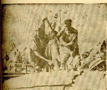
Aviones rojos caen sobre Castellón y se huyen de los que se batieron oscuras estropeadas.

La aviación roja pierde cinco aviones y probablemente otros tres más