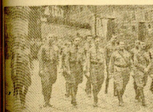
En el saliendo el grupo del nacional-socialismo recorre a los sus saldos de este aniversario del "putsch" de 1933.

Ismet Inonu El que fue brazo derecho de Ataturco encargado de continuar su obra