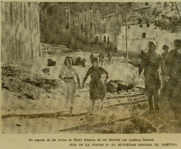
Un aspecto de las colinas de Pico después de ser liberada por nuestras tropas. VISTA EN LA PAGINA 34 DEL REPORTE GRAFICO DEL CUARTEL.

En la noche del 5 al 6 y el puerto de Cortapes, avanzaron a un hueco al de Palanés, destruyendo depósitos y baterías antiaéreas, y el de San Félix de Guadalupe.