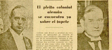
El presidente del Gobierno inglés, Mr. Chamberlain, que mañana presentará un discurso en el Congreso del Partido Radical-Bastardos.

El pleito colonial alemán se encuentra ya sobre el tapete El primer ministro de Chamberlain, en su discurso, se refiere a la reconciliación que una política internacional, según plantea la doctrina de la reconciliación, que se encuentra ya sobre el tapete.