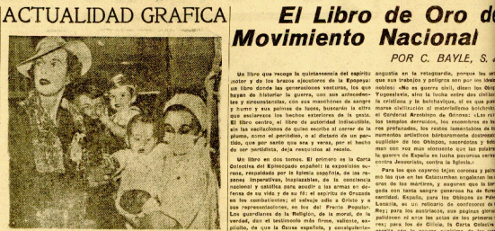
La Princesa de Polonia. Durante un momento en París, ha visitado la...