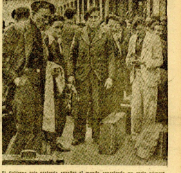
El Gobierno rojo pretende ocupar el mundo septentrional en esta semana...

UN TELEGRAMA DE FRANCO A MUSSOLINI Burgos. — El querido Franco ha enviado el siguiente telegrama al Duce: "Al dejar abandonada parte de los voluntarios italianos que iban allá contribuyendo de hecho a la causa nacional, en dos días de remoción y hincapié de la España Nacional, que se dejó más pronto a Italia que a la España Nacional, que se dejó más pronto a Italia que a la España Nacional, que se dejó más pronto a Italia que a la España Nacional..."