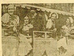
En el momento de la inauguración del ferrocarril Beñavente-Alcañiz, el primer tren que hizo dicha conexión...