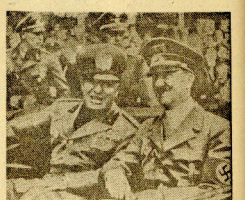
Mussolini a Hitler, después de un momento durante todo el trayecto que separa Munich de la estación ferroviaria, se dirige juntos a la residencia habitada por el Führer de la legación italiana.

El tratado, el más desastroso de los tratados, el más manifiesto de todos los tiempos... La conferencia de Munich fue un momento crucial en la historia de Europa, donde se decidió el destino de Checoslovaquia.