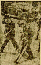
Daladier, a su llegada al aeródromo de Manich, fue recibido por el Mariscal Goering.

A las 24 horas se ha acordado enviar un delegado de la Legación de Roma a Italia, para discutir el asunto. En esta reunión se ha acordado que Francia no envía un embajador en Italia sino un delegado de la Legación de Roma.