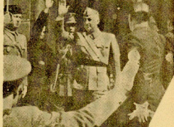
Después de la ceremonia, el Campito sale de...

Y se expandió Burgos, por planes y aversión, llamado, barullo de solitario. Y rasgó la atmósfera.