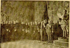
El Generalísimo los su discursos.