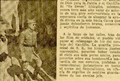
El General Millán Astray.