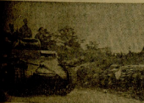
Los nuestros cierran líneas de combate en el frente de Teruel.

NUESTRAS FUERZAS HACEN AL ENEMIGO 300 MUERTOS Y 214 PRISIONEROS