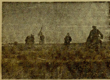
Soldados del Ejército nacional avanzando por tierras de Levante.

La penetración en territorio enemigo alcanzó 10 kilómetros de fondo