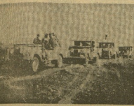
TOPAS DE OMAN

La refinería de petróleo de una capacidad de 100.000 toneladas al día, en la zona de Massirah, Sur de Yemen y al sur de Omán, se ha convertido en una importante concentración de la vida del mundo petrolero, por su posición en el golfo del Omán y por su posición en el camino de las líneas aéreas que comunican a Europa con el Oriente Medio y con el Golfo Pérsico.