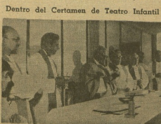
El primer trabajo de la Orquesta del Colegio Mártires de Guadalupe, presentando la ópera 'El niño cantor' de Luigi Donizetti.