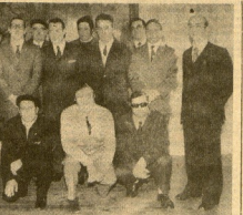
El homenaje, con la actuación de los grupos de baile.

El domingo pasado se celebró una sesión de Euzkadi. El domingo pasado se celebró una sesión de Euzkadi. El domingo pasado se celebró una sesión de Euzkadi.