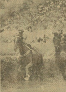
El caballo ganador del Premio Juan Pagola...