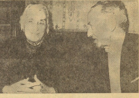
Bilbao. — El presidente del Partido Comunista de España, Dolores Ibarruri, visitó ayer en el Palacio de la Diputación Fondo del Señor de Euzkadi...

El PC de Euzkadi de convocar a su congreso de mítines sobre la Constitución hoy.