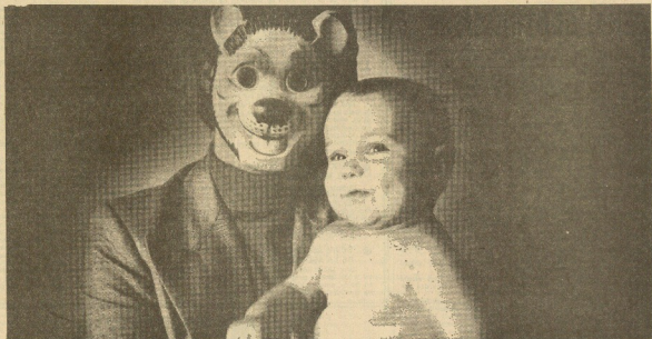
Donar sangre: un gesto anónimo para salvar una vida.

CAJA LABORAL POPULAR CAJA DE AHORROS MUNICIPAL DE SAN SEBASTIAN CAJA DE AHORROS PROVINCIAL DE GUIPUZCOA