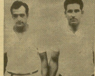
Oreja III y Ortega II, que esta tarde disputarán en Vergara la final de la competición...