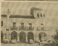
Fachada del Ayuntamiento, en uno de cuyos despachos tuvo lugar el mortal atentado.