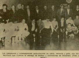
Los compañeros y subcompaños guionistas de esta revista y a ellos con los letrados que hicieron el trabajo y distribuyeron en Galarza