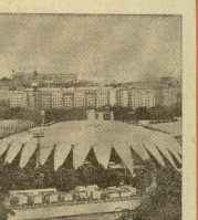
Una de las más prestigiosas... en la ciudad de Taipei...