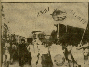
La marcha a Lemóniz fue recibida en el Arenal bilbaíno. (Termino Efe)