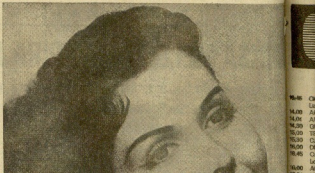
EMPEZO GANANDO 150 DOLARES A LA SEMANA

Tras una breve estancia en el teatro de Broadway, volvió al cine en 1946 con "The Sign of the Cross". Su primera película fue "The Sign of the Cross" en 1944.