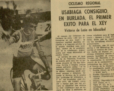
Vilamago con el viento después del triunfo.