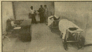
Hasta en los pasillos hay enfermos...

De "caótica y grave" calificaron a LA VOZ la situación por la que atraviesa en estos momentos la Residencia Sanitaria Nuestra Señora de Arantzazu miembros del comité de empresa de dicho centro hospitalario. Desde hace cinco años tiene una sobrecapacidad de inermados —cuerpo a más del 90 por 100 de la población guipuzcoana— y en los pasillos hay camillas con enfermos. Por otro parte, el servicio de urgencias no puede utilizarse porque Modül no ayu-