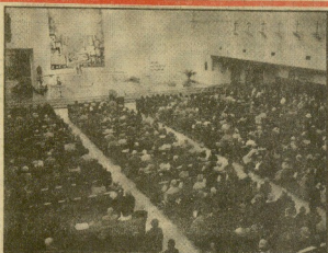
Diversos, autógrafos y referencias, tras para los honores del domingo