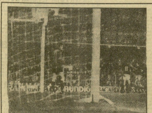
Del de los jugadores. Arribada ante el balón, en centro de la partida.

El PSOE del País Valenciano, que durante el pasado congreso extraordinario no se vio representado en la Ejecutiva, ha sufrido una escisión capitalizada por los militantes más radicalizados del llamado sector crítico, que magnitud es difícil precisar en los primeros momentos. Si tras el citado congreso los militantes valencianos se entendieron que las causas de su alejamiento se debían fijar en la crisis registrada en su país con el ex-candidato de Martínez Costellano, excolectado de Valencia, y expulsado del partido, y del presidente del Consejo, Albino, el detonante final surgió ayer con un llamamiento a todos los socialistas - marxistas para formar un partido que no «será socialista si no es marxista». El grupo escindido, que se autodenomina «coordinadora socialista-marxista», celebrará hoy una rueda de prensa en la que dará a conocer sus nombres, entre los que pueden figurar el secretario de UGT de Castellón y algunos diputados. Página 14