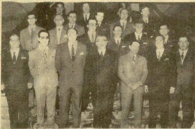
Miembros del nuevo Ayuntamiento de San Sebastián, que quedó constituido el domingo. Igualmente se celebraron actos similares en todos los Municipios de la provincia. De tales constituciones damos información en las páginas locales y de Guipúzcoa.