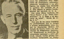
El mundo enter... ha sido arrojado por... la muerte de un autor...