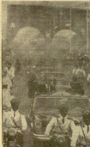
El presidente francés, Georges Pompidou, y el presidente de Costa del Marfil, Felix Houphouët-Boigny, precedidos por los motoristas, hacen una triunfal entrada en la capital, Abidjan.