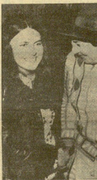
La líder irlandesa de los derechos civiles, Bernadette Devlin, saluda a la senadora Betty Abzug, miembro del Congreso norteamericano, defensora también de los derechos civiles. La joven parlamentaria irlandesa intervino en una reunión de las mujeres norteamericanas defensoras de la igualdad de derechos civiles.

★ La huelga postal británica entra en su cuarta semana