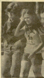
Una de las cenas que caracterizan a las fiestas de San Fermín es la presencia de chicas guapas. Bellas procedentes de los más varios lugares, las calles y plazas de Pamplona.

Como muestra, las dos jóvenes de la "foto" que ha captado nuestro correspondiente gráfico, Gómez. (Información en la 21.ª página.)