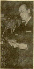
El director general de Cultura Popular, don Enrique Thomas de Cárpana, pronunciando el discurso inaugural del XIX Festival Internacional del Cine de San Sebastián. (Información en la 12.ª página.)