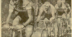
Ortiz marcando el tren de los escapados.

Mañabal, Andiano, Moral, Murillo, Bengoa y Aizpuru, selección guipuzcoana para Lesaca. Se dice que Gabriel Saura dirigirá un equipo profesional la próxima temporada. Se prevé una reunión inmediata al objeto de preparar la campaña de ciclo-cross.